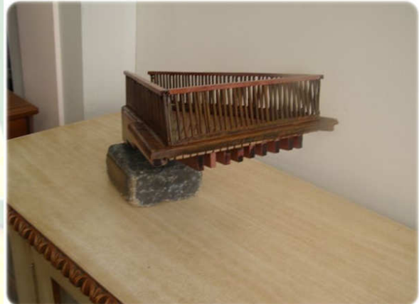
Voladizo 2 bis