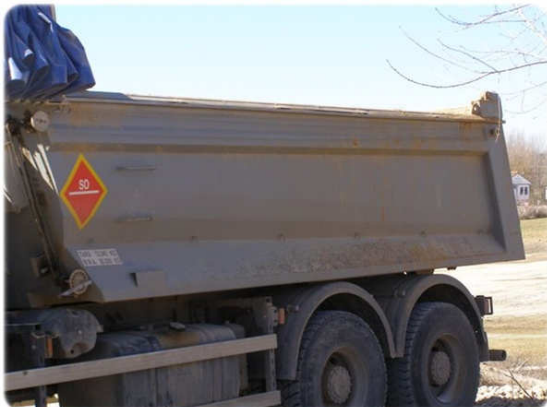
Reparación y adecuación Cajas de Camiones