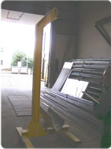
Soporte para Aspas de Molino