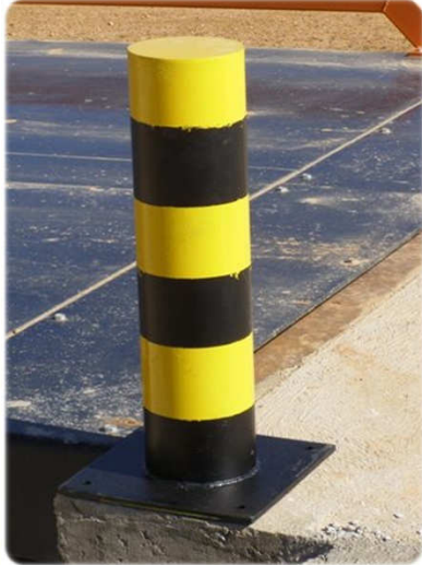
Bolardo Planta Escombros